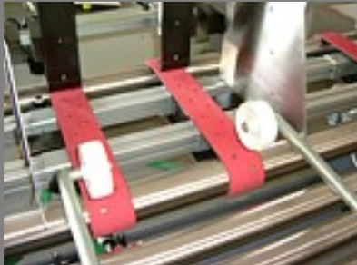
dva sací pásy