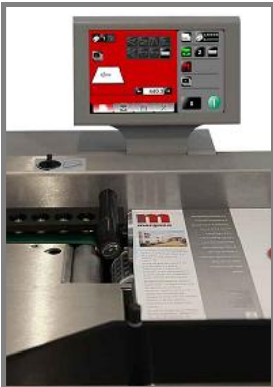
Autocreaser PRO - ovl.panel